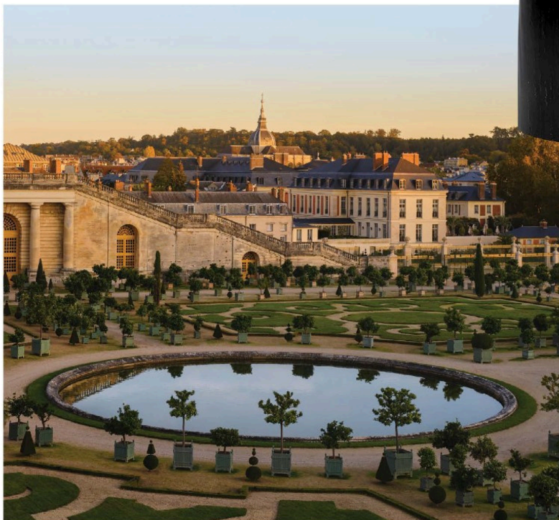
EXPERIENCIAS Arriba: vela y portavelas, de DIPTYQUE; izda.: vista exterior de Le Grand Contrôle, Versailles.