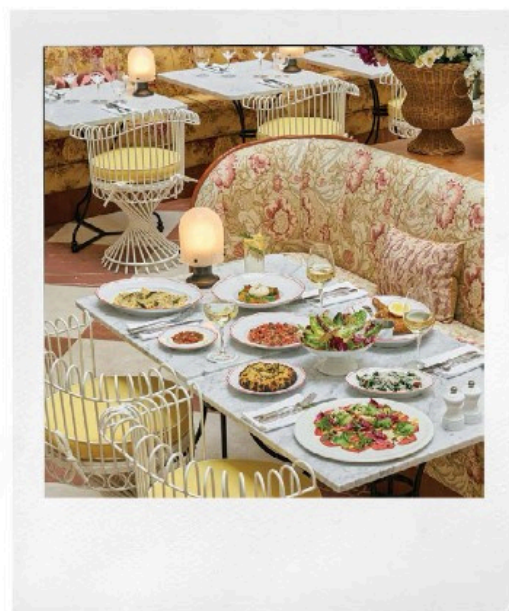
ATENCIÓN EXQUISITA Desde arriba: vista al lobby de Bella Grande; banco de NORMANN COPENHAGEN; detalle de platillos creados para el restaurante Cofoco.

Un extra que vale la pena destacar de este lugar, es que su lujo en clave sustentable permite brindar una experiencia renovada, que no necesita mayor competencia. Por ejemplo, su restaurante Cofoco se maneja con una filosofía circular, que permite disfrutar de cada bocado y momento sin limitaciones.